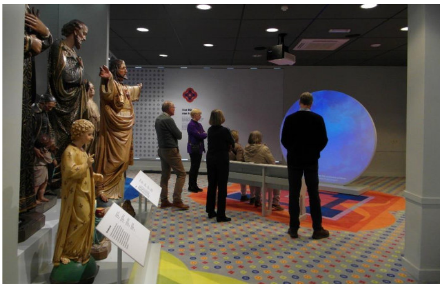
Museum De Pelgrim in Oldenzaal