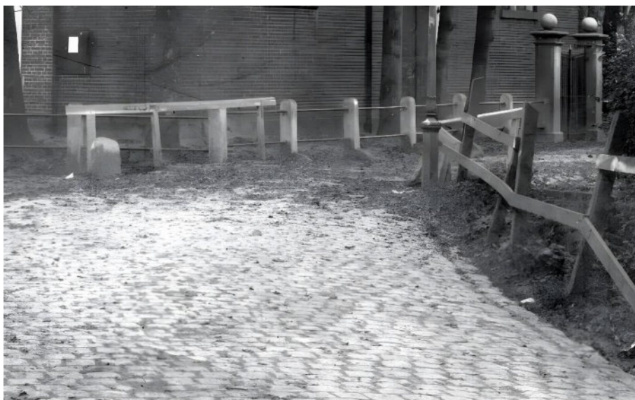
Bruggetje over de dorpsbeek bij de Hervormde kerk. (opname ongeveer 1920). De veldkei-bestrating is ook goed te zien.

Reparaties aan de bruggen komen zowel in 1802 als 1804 voor. Het zal hier over de bruggetjes over de dorpsbeek gaan in de (huidige) Brinkstraat en Kerkstraat.