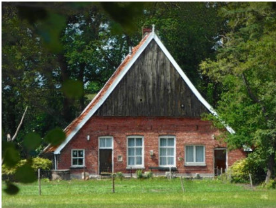
Erve Honiglo aan de Dene-kamperdijk

'Martini' betekent de dag van het feest van St. Martinus (11 november). Het was de gebruikelijke dag (nadat de oogst binnen en verkocht was) dat huren, tienden en andere jaarlijkse verplichtingen werden betaald.