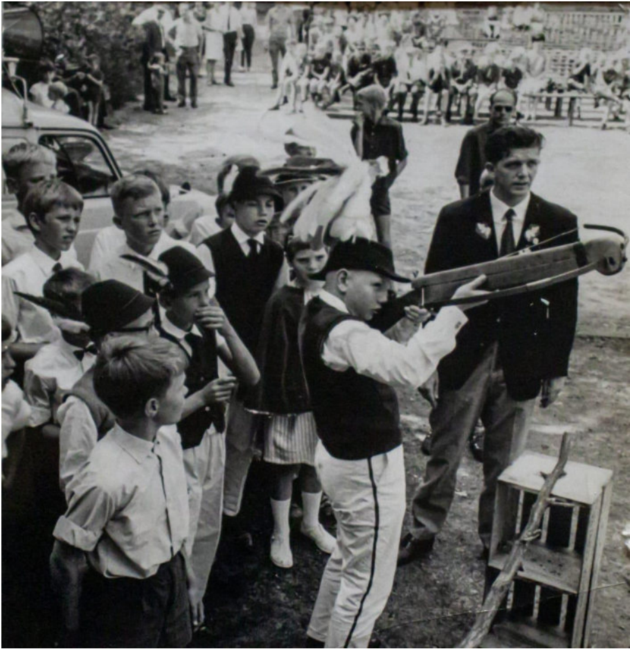
Bij de jeugd staat het kruisboogschieten hoog in het vaandel. Hier onder leiding van de heer J. Nijenhuis.