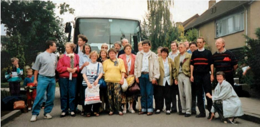
Bewoners van de Neercasselstraat met hun Russische bezoekers.

het aangaan van persoonlijke contacten. Eerst Losser-Widnoje, dan misschien Nederland-Sovjet Unie en uiteindelijk wellicht de ontspanning tussen Oost en West.