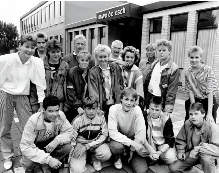
Losserse Mavoleerlingen die in 1987 Widnoje bezochten. Wij beschikken niet over de namen van de Losserse scholieren. Misschien herkennen zij zichzelf, nu 36 jaar later?