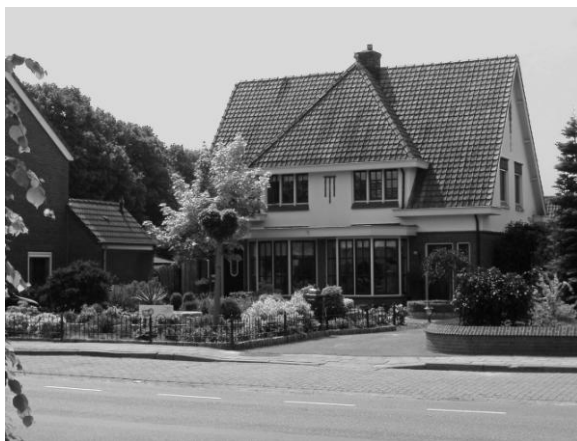
Anno 2008 staat het huis er nog steeds.

In 1928 verhuisde het gezin naar Overdinkel. Moeder zat met haar zus Stien achter op de wagen met paard. Stien moest op haar letten. Hoofdstraat 60 werd het nieuwe tehuis. Het - twee onder één kap - huis had een geheel eigen stijl, die nergens in Overdinkel te vinden is.