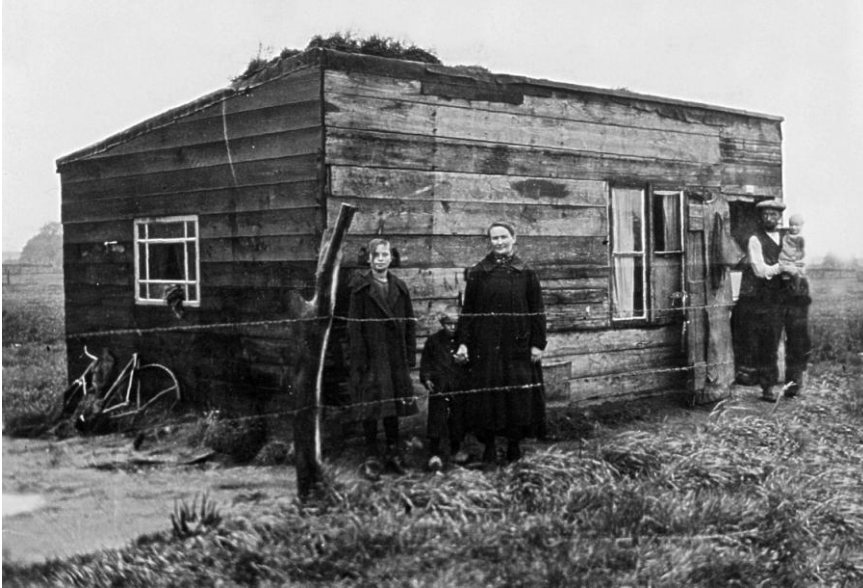
Een voorbeeld van de 'woonsituatie' van een arbeidersgezin in Overdinkel in het begin van de 20-ste eeuw.