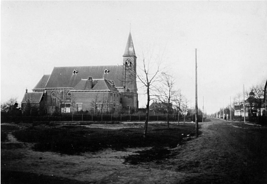
De H. Gerardus Majellakerk in Overdinkel: 'Een onwaarschijnlijk fraai en kolossaal gotisch bouwwerk'.