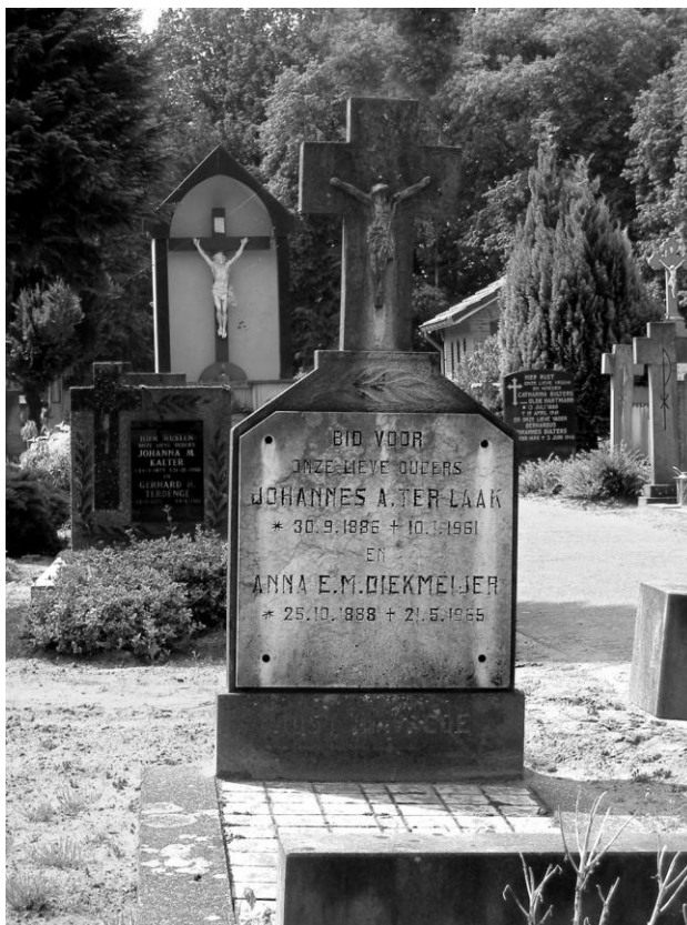
Het graf van opa en oma ter Laak op de begraafplaats van de H. Gerardus Majellakerk in Overdinkel.

De mensen, met veelal grote gezinnen, werden vaak met kindersterfte geconfronteerd. Van enige luxe zoals wij die thans in het begin van de 21 e eeuw kennen was geen sprake.