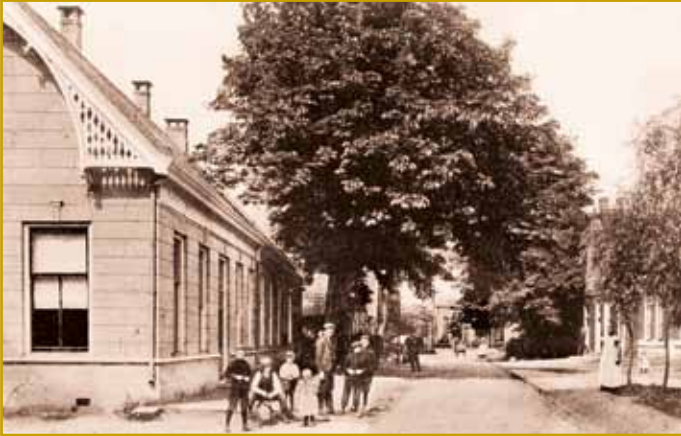
Het oude gemeentehuis van Losser omstreeks 1910

De gemeente bestond uit enkele geïsoleerd liggende boerenplaatsjes in een weinig bekende oosthoek van Nederland, zonder groeikracht, zonder handelsgeest en zonder vertier. Losser was met de buitenwereld verbonden door een erbarmelijk slechte keiweg naar Oldenzaal, waar bovendien nog tol werd geheven. Om van de wegen naar Enschede of de Beekhoek maar te zwijgen. Dat waren niet meer dan karrensporen. Toch was er in 1890 wel enige nijverheid. In veel huizen in het dorp was het geluid van weefgetouwen te horen.