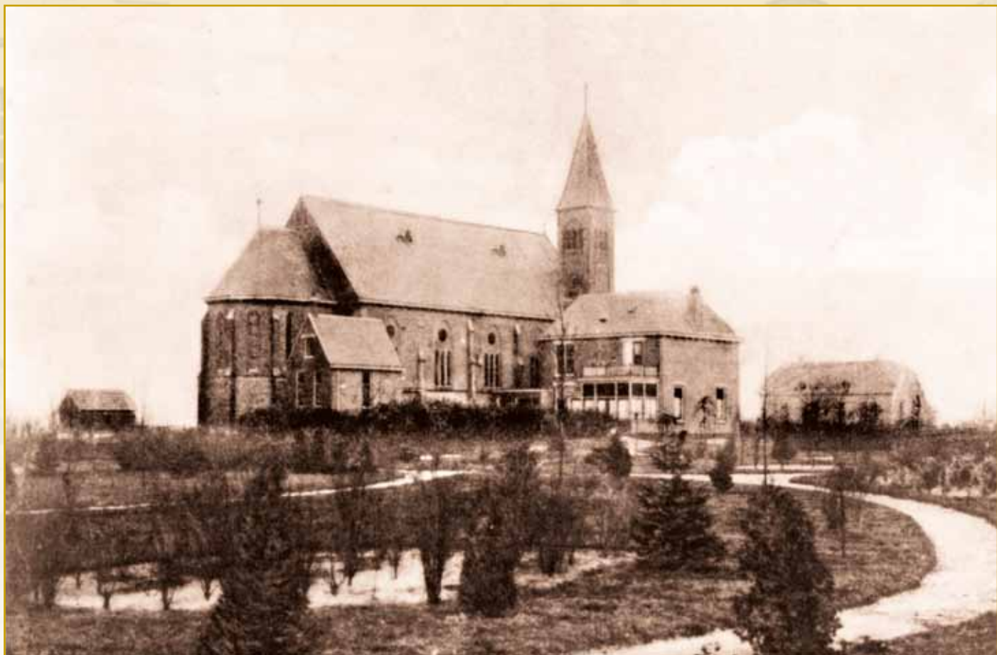
R.K. Gerardus Majellakerk in Overdinkel, kort na de bouw in 1911

Onkerkelijken worden er in Losser in 1890 nog helemaal niet vermeld. In godsdienstig opzicht hadden de mensen roerige periodes achter de rug. In 1810 hadden de katholieken, in opdracht van Lodewijk Napoleon, hun kerkgebouw, dat zij na de reformatie aan de protestanten hadden moeten afstaan, teruggekregen. De 'grote' kerk werd teruggegeven aan de grootste godsdienstige gemeenschap. Losser telde destijds 845 katholieken en 146 protestanten. De protestanten bouwden nog in hetzelfde jaar hun nieuwe kerk aan het (huidige) Raadhuisplein.