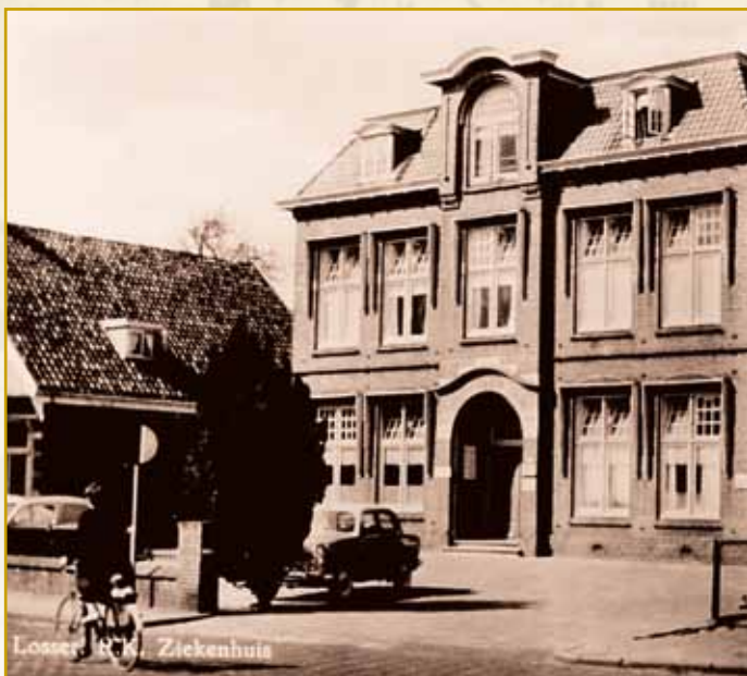
R.K. Ziekenhuis "St. Bernardus Gesticht" in Losser (1955)

Een half jaar voor de komst van burgemeester Van Helvoort had Losser eindelijk elektriciteit gekregen. De vestiging van de melkfabriek 'Dinkelland' in 1921 en van de textiel fabriek van Van Heek in 1926 hebben ook belangrijk bijgedragen aan de verdere welvaarts-groei van Losser. In dat kader past ook de bouw in 1916 van het Sint Bernardus Gesticht voor de verzorging van ouden van dagen en verpleging van zieken.