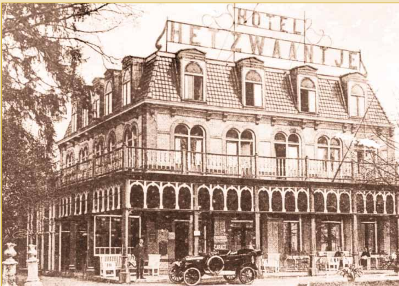
Hotel 'Het Zwaantje' in De Lutte omstreeks 1910