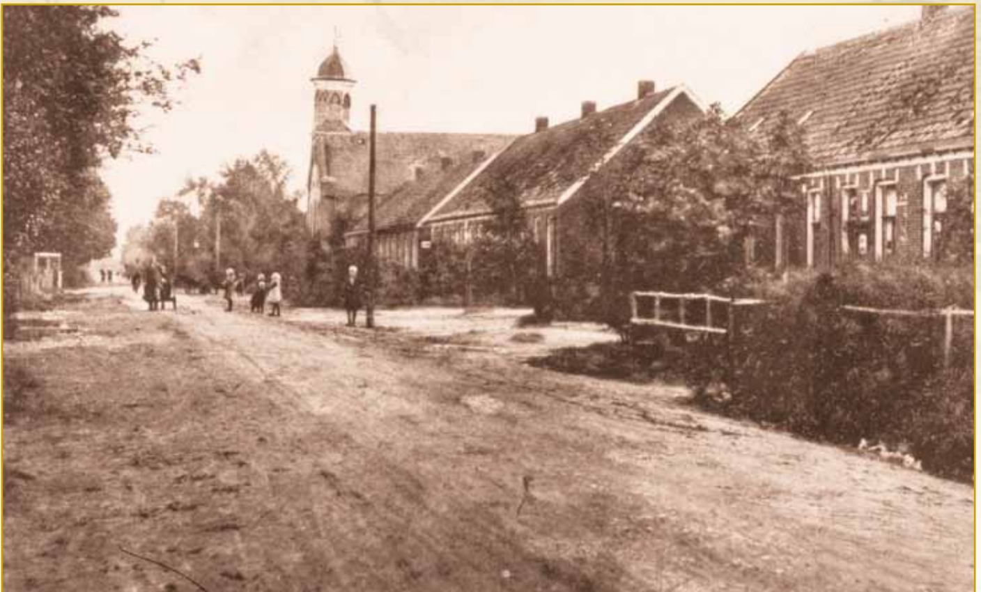
Doorkijk van de Hoofdstraat in Overdinkel begin 1900

De boer stond achter het weefgetouw en de vrouw spon. Maar omdat mannen in de fabrieken gingen werken, leerden steeds meer vrouwen om ook met het weefgetouw om te gaan.