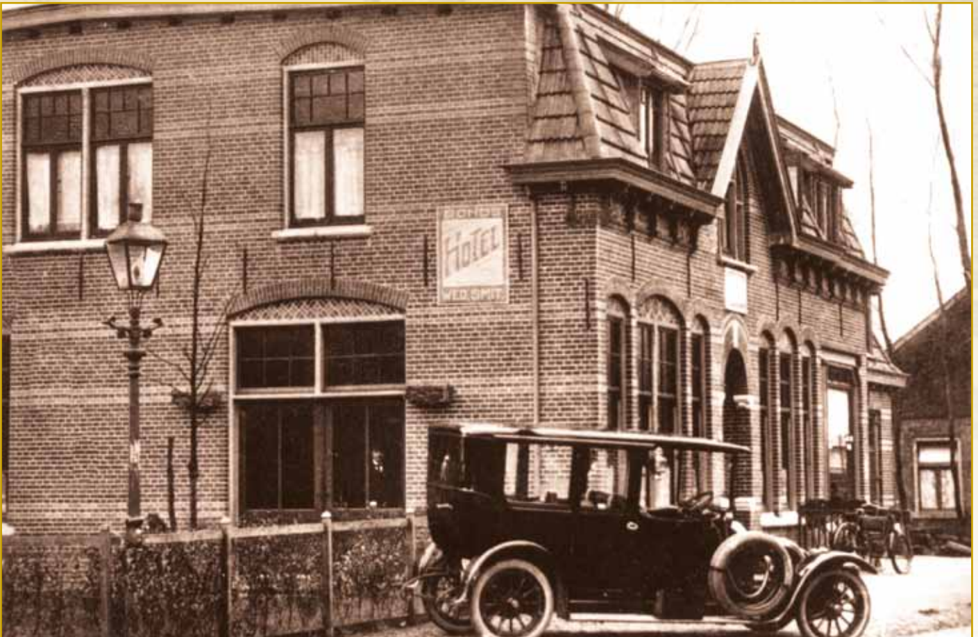
Hotel Smit in Losser omstreeks 1915